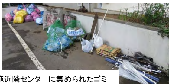
布施近隣センターに集められたゴミ

ご参加いただいた皆さま、ありがとうございました。成功裏に終了しました。感謝申し上げます。【環境部】