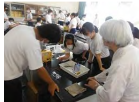
「水の電気分解」の実験