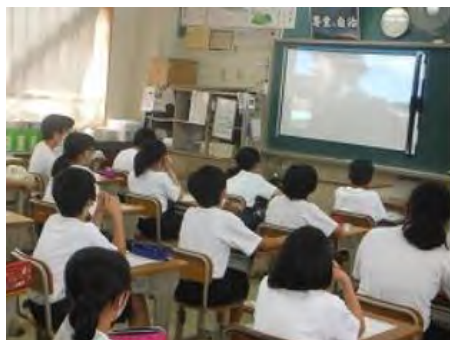
“いじめを許容しない”授業