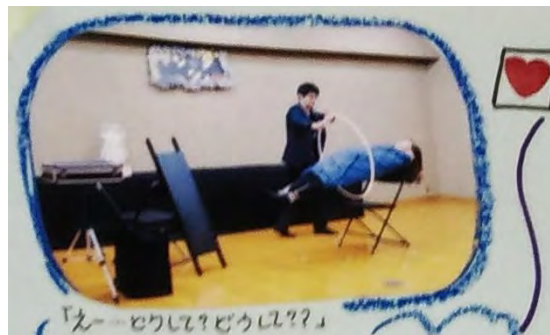
前年のマジックショーの一コマ