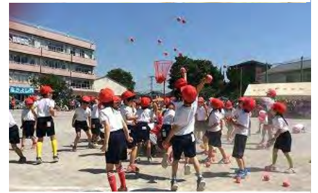
令和元年度運動会