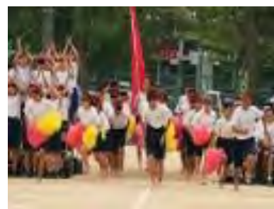
第 73 回体育祭

昨年度末から新型コロナウイルス感染症対応に追われていますが、新しい生活様式の中で生徒たちも頑張っています。引き続き、皆様のご理解・ご協力をいただきますよう宜しくお願い致します。