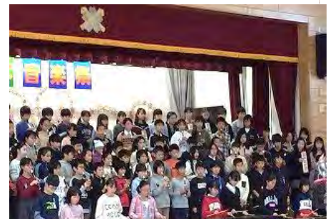
令和元年度くすのき音楽祭