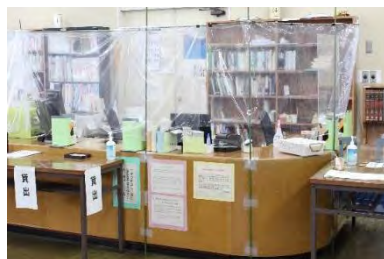
(写真は布施分館の様子)