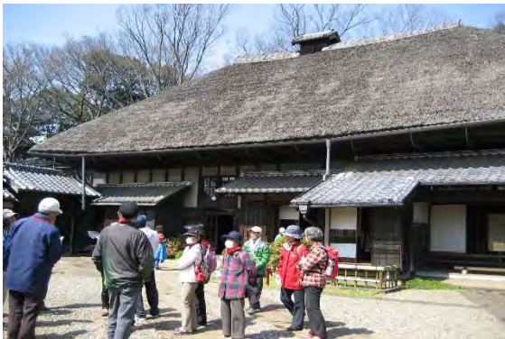
富勢ウォーク 旧吉田家住宅にて説明を聞く

その間の活動は事後承認となりますが、この一年も例年同様の活動を継続していくことにしております。ただ、役員・委員の高齢化に伴う交代要員不足や、八朔相撲大会基金の取り崩しなど一抹の不安を抱えての船出になります。地域の皆さま多くのご支援をお願い申し上げます。 【総務部】