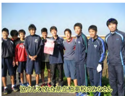
協力してくれた県立柏高校のみなさん

日ごろから監視の目を持って、防いでいけたら、きれいな利根川にしていけるのではないのでしょうか。 【環境部】