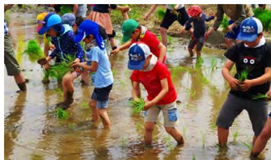
毎年恒例の田植え体験 あけぼの山農業公園