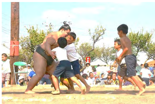
大相撲式秀部屋力士とチビっ子対決・昼食休憩時

ふれあい体育祭・八朔相撲大会については、ホームページ(ふるさと富勢で検索)にも掲載します。【総務部】