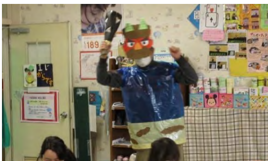
布施遊戯室 みんなでオニ退治(1/26)