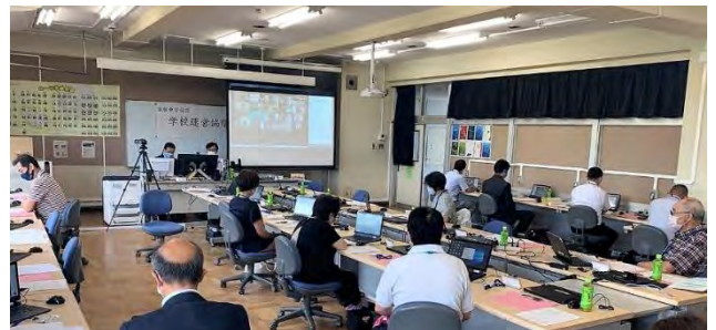
【寄稿 富勢中学校区学校運営協議会(富学協)】